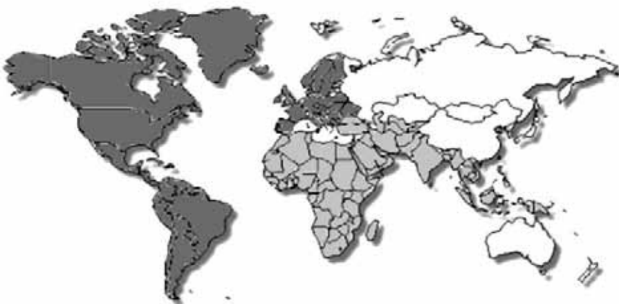
Répartition des recettes du tourisme dans le monde

Pour rejoindre Nadia Dolbec: education@plannagua.qc.ca